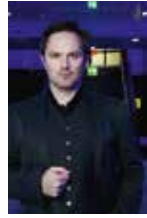
© Daniel Schneider / Andreas Winkler